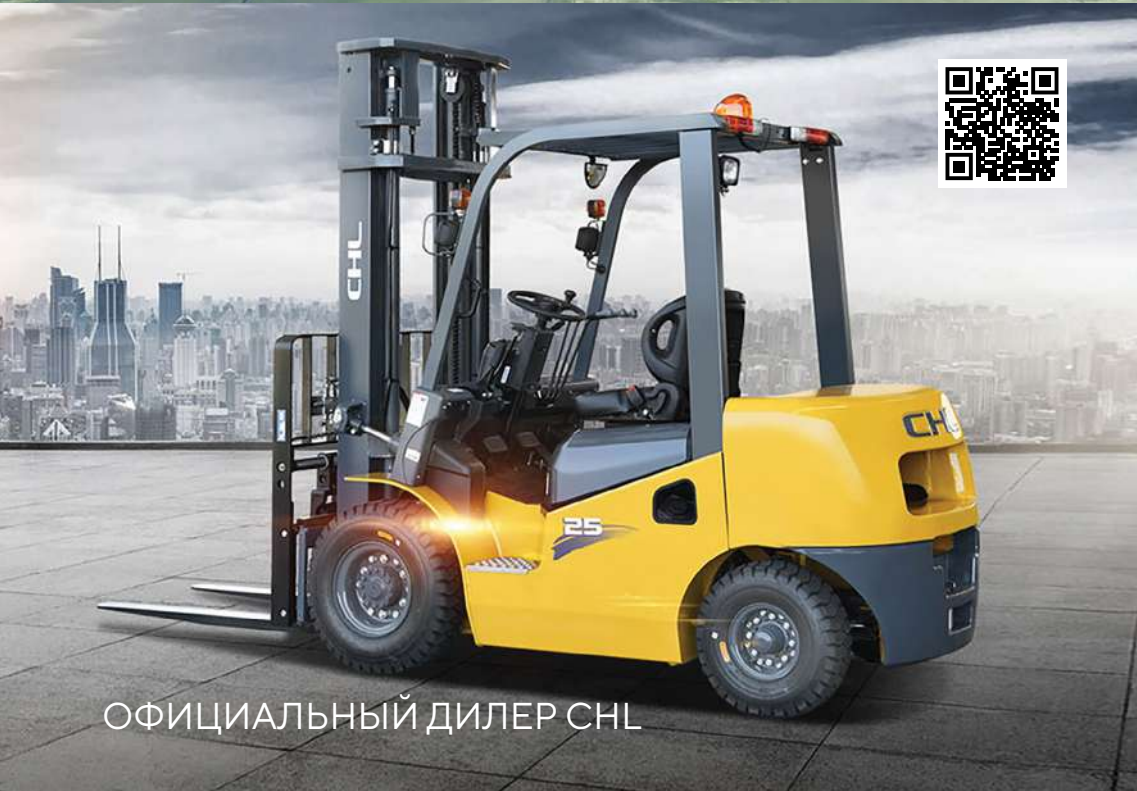
ОФИЦИАЛЬНЫЙ ДИЛЕР CHL