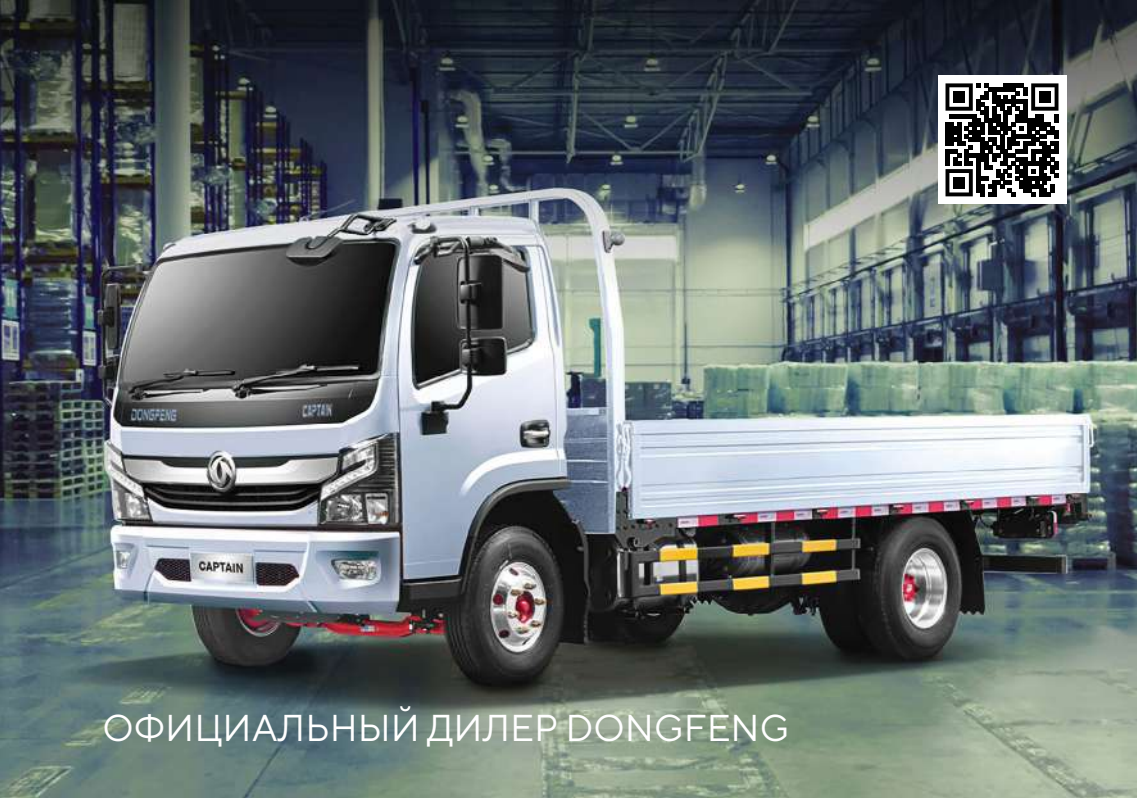
ОФИЦИАЛЬНЫЙ ДИЛЕР DONGFENG