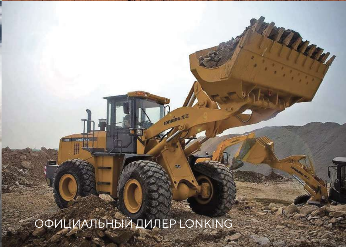
ОФИЦИАЛЬНЫЙ ДИЛЕР LONKING