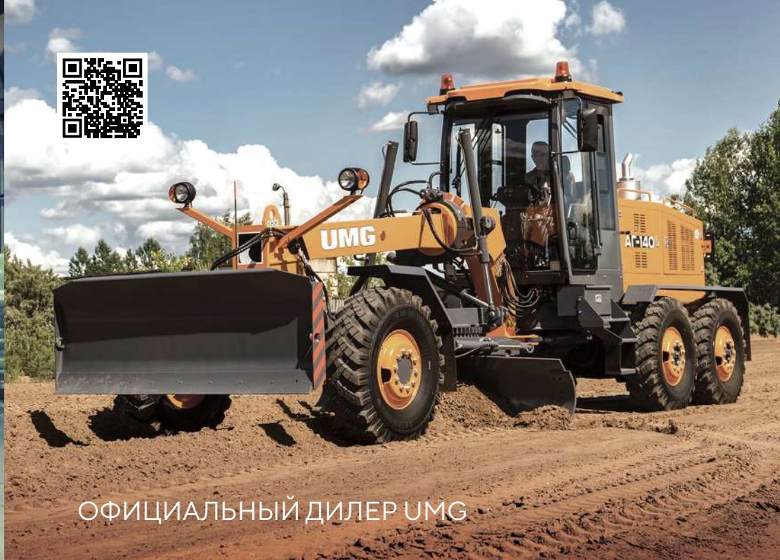
ОФИЦИАЛЬНЫЙ ДИЛЕР UMG